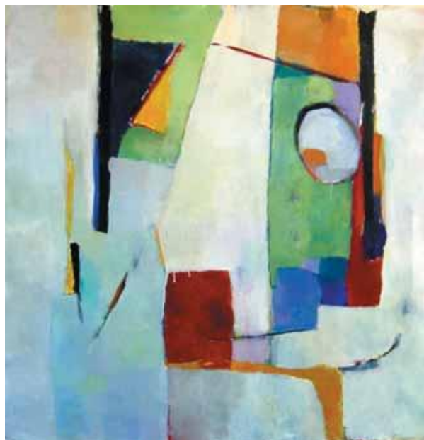
S/t, Acrílica, Milton Jeron, s/d.

Com isso, passa a ser visto como erro todo e qualquer uso que escape desse modelo idealizado, toda e qualquer opção que esteja distante da linguagem literária consagrada; toda pronúncia, todo vocabulário e toda sintaxe que revelem a origem social desprestigiada do falante; tudo o que não conste dos usos das classes sociais letradas urbanas com acesso à escolarização formal e à cultura legitimada. Assim, fica excluída do “bem falar” a imensa maioria das pessoas – um tipo de exclusão que se perpetua em boa medida até a atualidade.