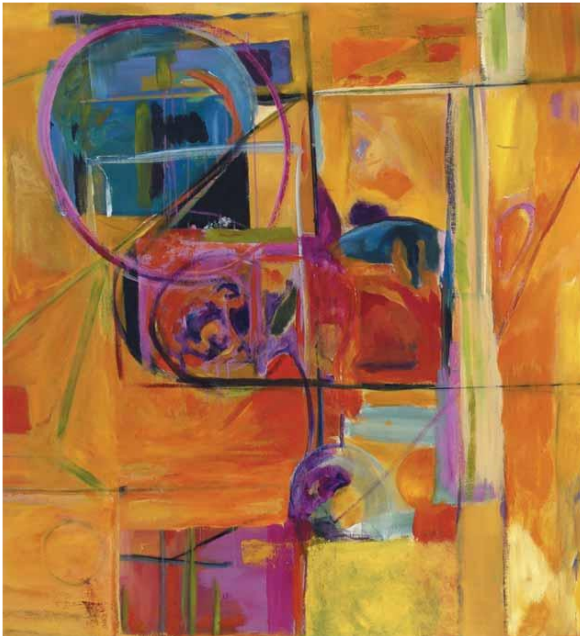
Sem título, Milton Jeron, s/d.